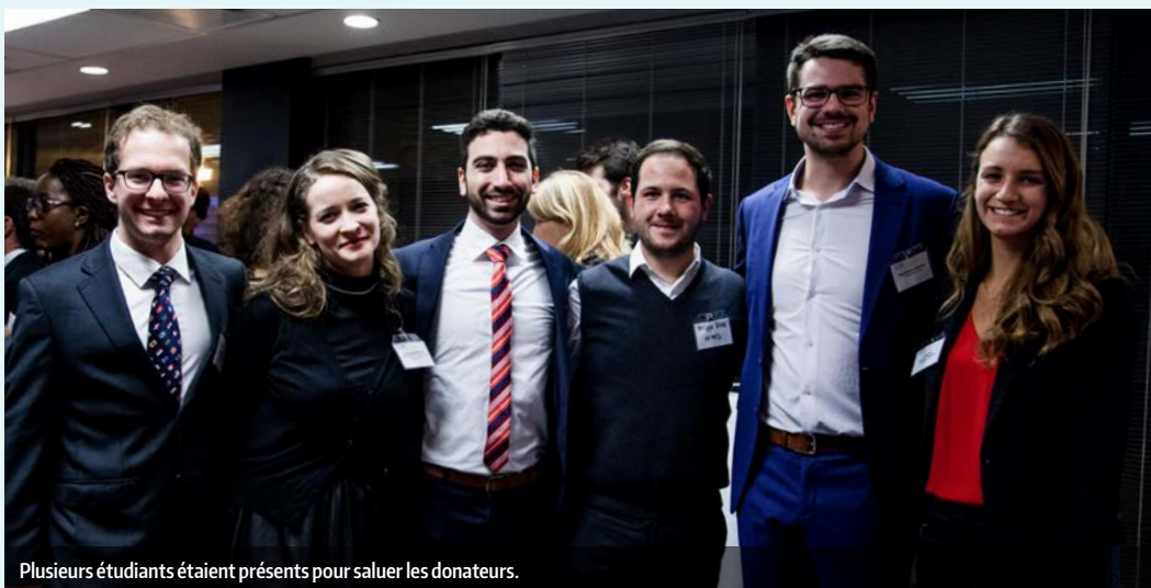
Plusieurs étudiants étaient présents pour saluer les donateurs.