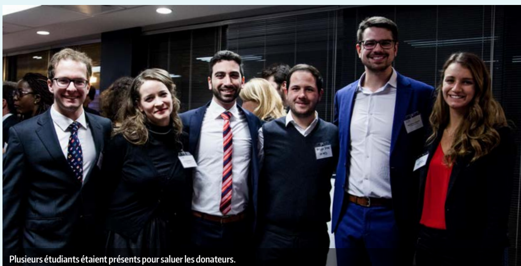
Plusieurs étudiants étaient présents pour saluer les donateurs.