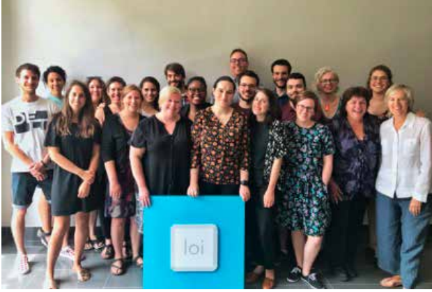
Une partie de l'équipe d'Éducaloi

Par exemple, grâce aux outils pédagogiques d'Éducaloi, les étudiants de la Clinique de médiation de l'Université de Montréal (CMUM), ont animé avec succès l'atelier « Notre solution, notre conflit » devant des élèves de secondaire. En plus d'aider les jeunes à mieux comprendre la loi et leurs droits, les ateliers d'Éducaloi leur permettent également de se familiariser avec les métiers de la loi.